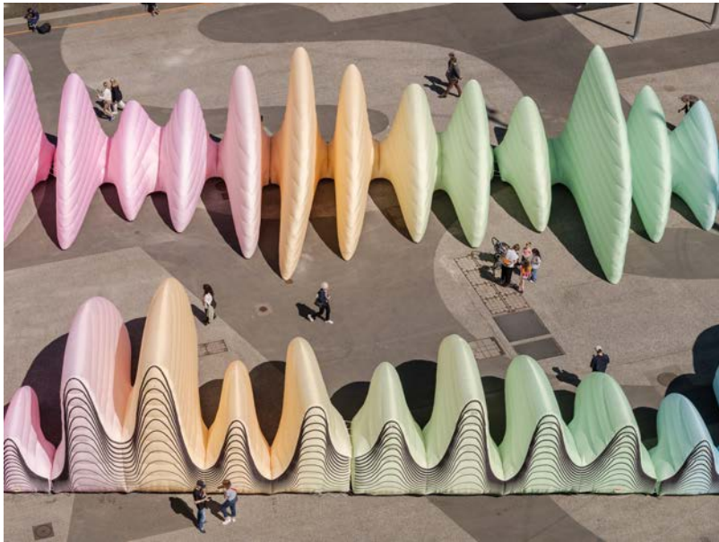
Le décor conçu pour l'Eurovision à Bâle, 2025.