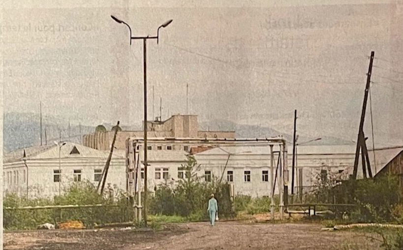
La dame en bleu. Oust-Nera. 2006. MAGALI KOENIG

Le conditionnel passé prévaut à l'heure où la guerre tend à éclipser le monde et la culture russes derrière les agissements d'un Etat criminel. Raison pour laquelle ce bel ouvrage rétrospectif tombe à point nommé. Sorti de presse chez Genoud Arts graphiques, «la Rolls de l'imprimerie», il