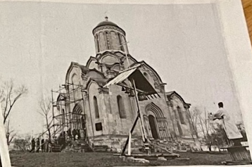
«Le monastère d'Andrei Roublev», Moscou, Russie, 1992.

La photographe de Vevey compile 30 ans de voyages dans l'ouvrage «Courir après la pluie».