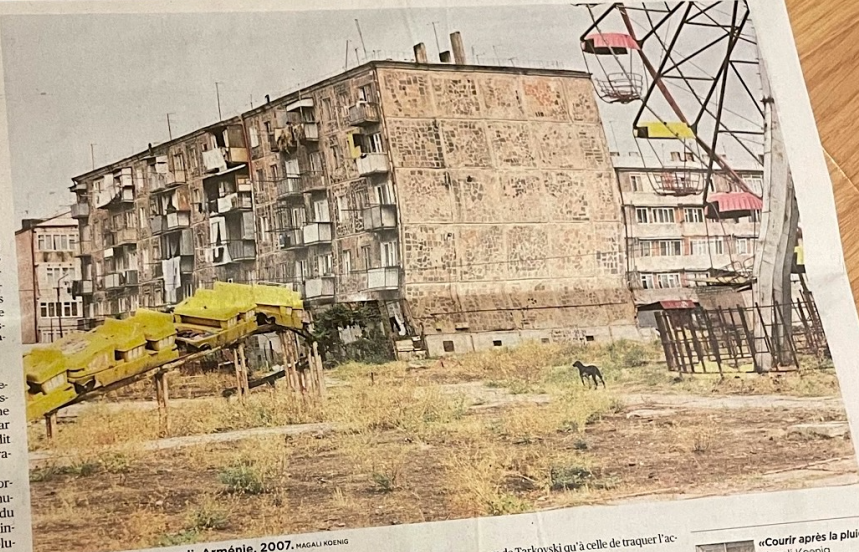
«Un chien noir», Alaverdi, Arménie, 2007. MAGALI KOENIG

Cette suspension de ce que l'on pourrait qualifier de miroir anthropologique confère une grande liberté au regard, à l'interprétation, à la projection dans les univers qu'elle délivre. La photographe voyageuse, qui n'imagine pas prendre une image de quelqu'un sans lui demander la permission, concède qu'en matière de gens, «il y en a juste assez».